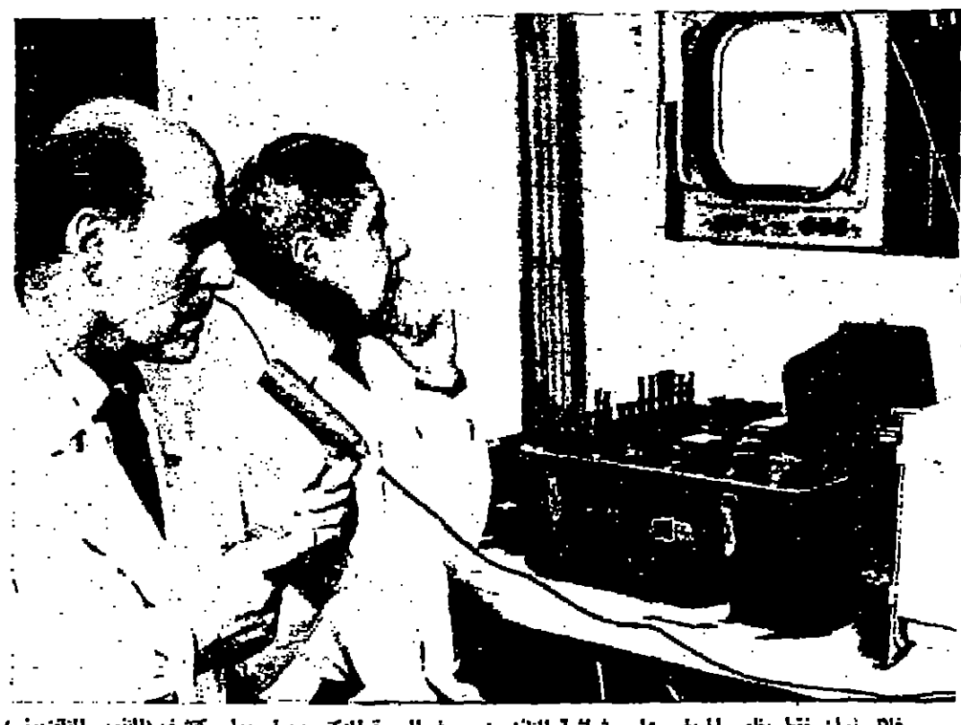
خلال نوان تظ يظهر المريض على شاشة التلفزيون - وفي الصورة الدكتور ب.أ. بول مختف (التويم التلفزيوني) لاغناء الامر الى المريض بالتويم، والى يمينه الدكتور بولكو يستعدان

وهذه التطورات الباهرة، هي من نتائج فريضة علمي روسي في الطب يدعى (ب.أ. بول) الذي كان مهتما بمعالجة مرضى التهاب القصبات، والصابين بالأزمات الصدرية (الربو)، فوجد أنهم يحتاجون الى «الهواء الخفيف» أي ذي الكثافة القليلة. ولكن المشكلة التي واجهته كانت عدم قدرة الناس على احتمال (الهواء الخفيف) في نفس الجو الذي يجري فيه